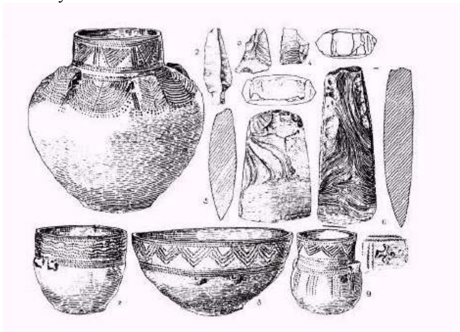
Ryc. 81. Rębków-Parcele, pow. Garwolin. Zabytki z grobu I.

skrzyni. Był to grób z obstawą długości około 3 m i szerokości około 1,5 m. Obstawa składała się ze średniej wielkości głazów narzutowych. Dno grobu na głębokości około 3,50 m było wybrukowane płaskimi, mniejszymi kamieniami. Nad grobem znajdował się również bruk stanowiący nakrywą grobu. W środku długości komory grobowej znajdowała się poprzeczna przegroda, pionowa, dzieląca grób na dwie równe części. W grobie było co najmniej osiem naczyń, z czego cztery dochowały się mniej więcej w całości. Ponadto znaleziono w grobie dwie siekiery