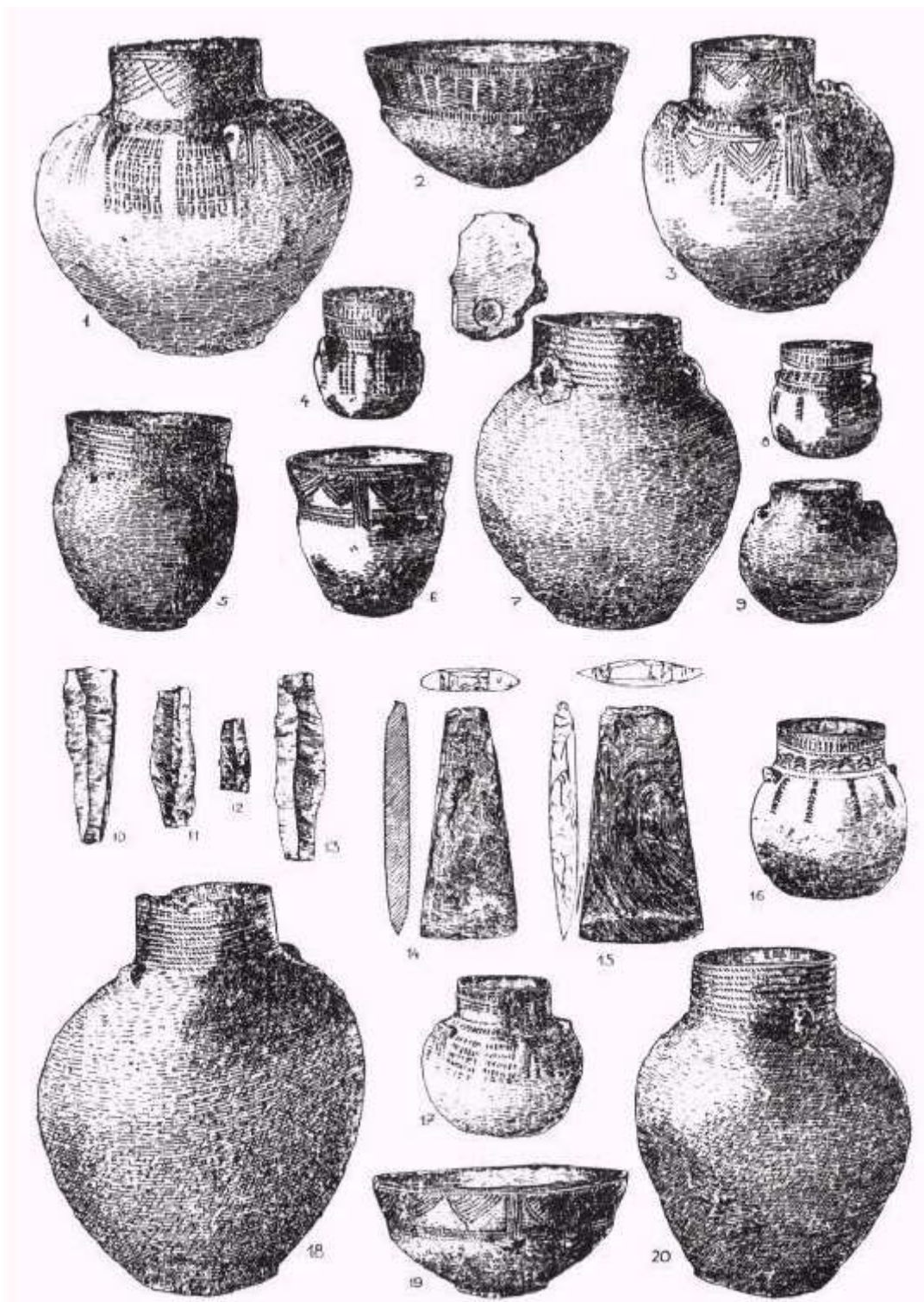
Ryc. 84. Rębków-Parcele, pow. Garwolin. Inwentarz grobu II:

1 — amfora (naczynie 6). W. 27 cm; 2 — misa (naczynie 3). W. 11 cm; 3 — amfora (naczynie I). W. 22 cm; 4 — amforka (naczynie 14). W. 10 cm; 5 — puchar sznurowy (naczynie 9). W. 17,6 cm; 6 — czarka (naczynie 11). W. 13,4 cm; 7 — amfora jajowata ze swastyką wewnątrz (naczynie 3). W. 26 cm; 8 — amforka (naczynie 13). W. 9,8 cm; 9 — amforka (naczynie 5). W. 12 cm; 10—13 — wióry z krzemienia czekoladowego; 14—15 — siekiery z krzemienia pasiastego. D. 10,2 cm. 16 cm; 16 — amforka (naczynie 10). W. 15 cm; 17 — amforka (naczynie 7). W. 13 cm; 18 — amfora jajowata (naczynie 4). W. 34 cm; 19 — misa (naczynie 2). W. 9,8 cm; 20 — amfora jajowata (naczynie 12). W. 28 cm.